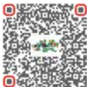
Consultor de massas vedantes